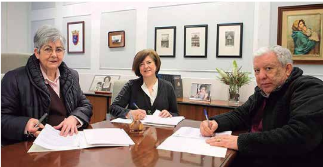
Representantes de Cocemfe, Ay. Pamplona y Teletaxi firman el convenio

Su implantación ha sido “un reto” ya que es un sistema pionero en el Estado que sólo han puesto en marcha Pamplona y la ciudad de Vigo. El bono-taxi llevaba muchos años funcionando en la ciudad, pero ha sido como iniciar un nuevo servicio. Sin embargo, la respuesta de ambos ha sido satisfactoria. Por ello, desde aquí agradecer “a todos los agentes implicados su esfuerzo”.