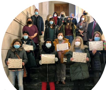
Diplomas para la inclusión: Nuevas “prácticas” en la Universidad de Navarra